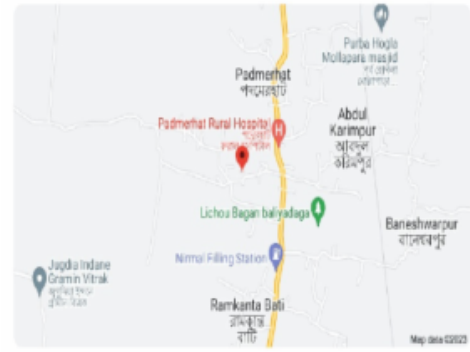
Map for 22.24376,88.445167