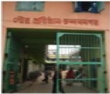
Polling Station Front View